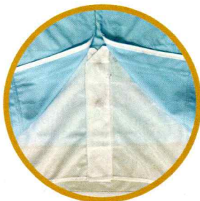
インナーカバーメッシュ (ジャケット) ズボンのウェストの中に入れること により 体毛落下防止