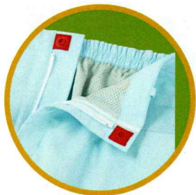
テープスナッパー ボタンが生地と一体化していることによる脱落の防止