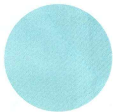
表地：高密度メッシュ構造 (良好な通気性・伸縮性)