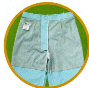
パンツの裏地メッシュ 透け防止