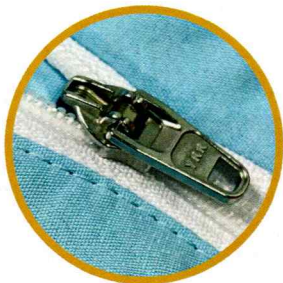
YKK セミオートマチックスライダー ファスナーロック機能